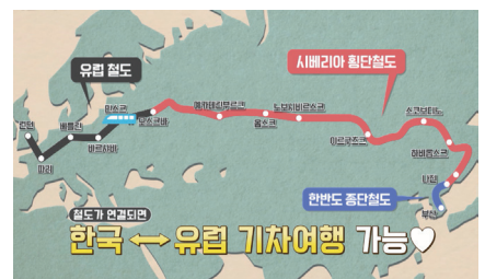
[나선특별시] 시베리아 횡단철도