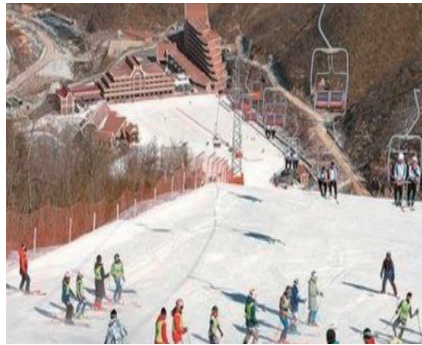
[강원도] 마식령 스키장