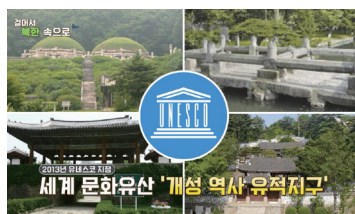
[개성특별시] 개성 역사 유적지구