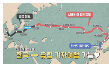
[나선특별시] 시베리아 횡단철도