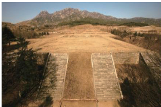
[개성특별시] 개성 만월대