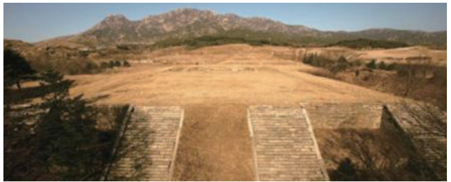
[개성특별시] 개성 만월대