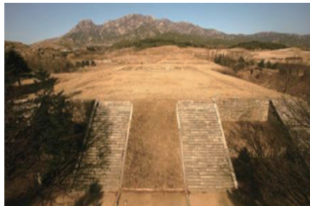
[개성특별시] 개성 만월대