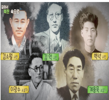
[평안북도] 유명한 문인들의 고향