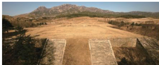
[개성특별시] 개성 만월대