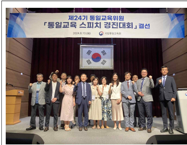
경진대회 참여자 전체 사진