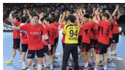
남자 핸드볼 남북 단일팀 (2019 세계 선수권 대회 참가)