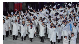
평창 올림픽 공동입장