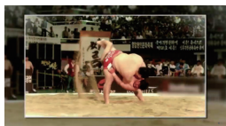
유네스코 문화유산 공동등재(씨름)